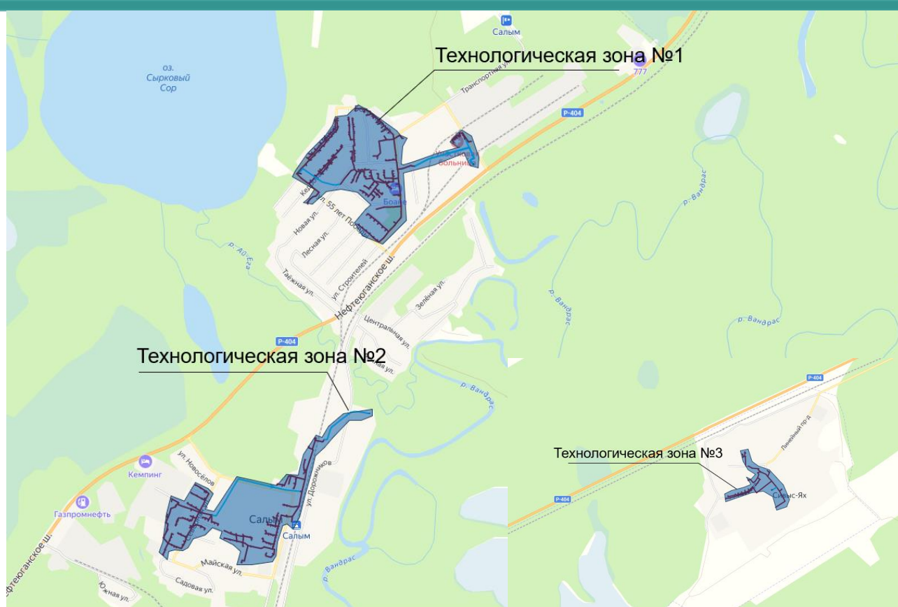
Рисунок 1.1.1. Технологические зоны в разрезе населенных пунктов